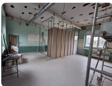
Cloisonnement du pôle accueil et bureau de la direction