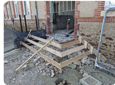
Des marches ainsi qu'un accès pour les personnes à mobilité réduite (PMR) prévu par l'arrière du bâtiment.