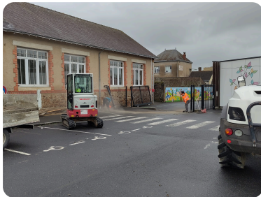
Déplacement du portail

Depuis les vacances de février, de nombreuses entreprises sont intervenues pour réaliser: