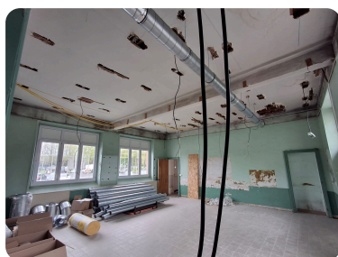
Installation d'une VMC dans tout le bâtiment

Depuis mars les travaux s'enchainent également à l'intérieur des classes pour leurs redonner un second souffle 🛠️.