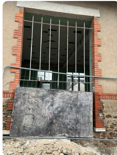
Une ouverture qui sera la nouvelle porte d'accès du pôle accueil