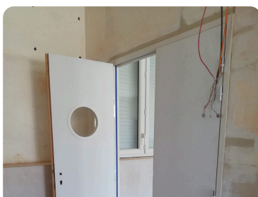
Réalisation d'ouvertures pour communiquer