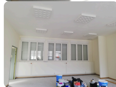
Finition du sol en cours Isolation des