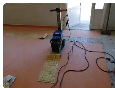
Réfection des sols avec traitement contre le radon