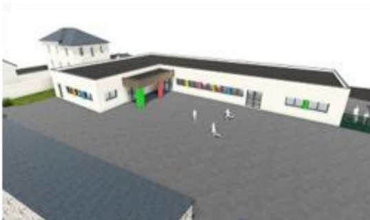
Futur bâtiment maternel